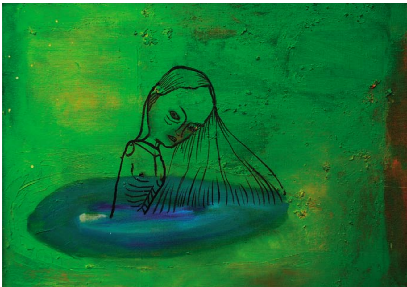
Tjern Olje på lerret 52 x 72 cm