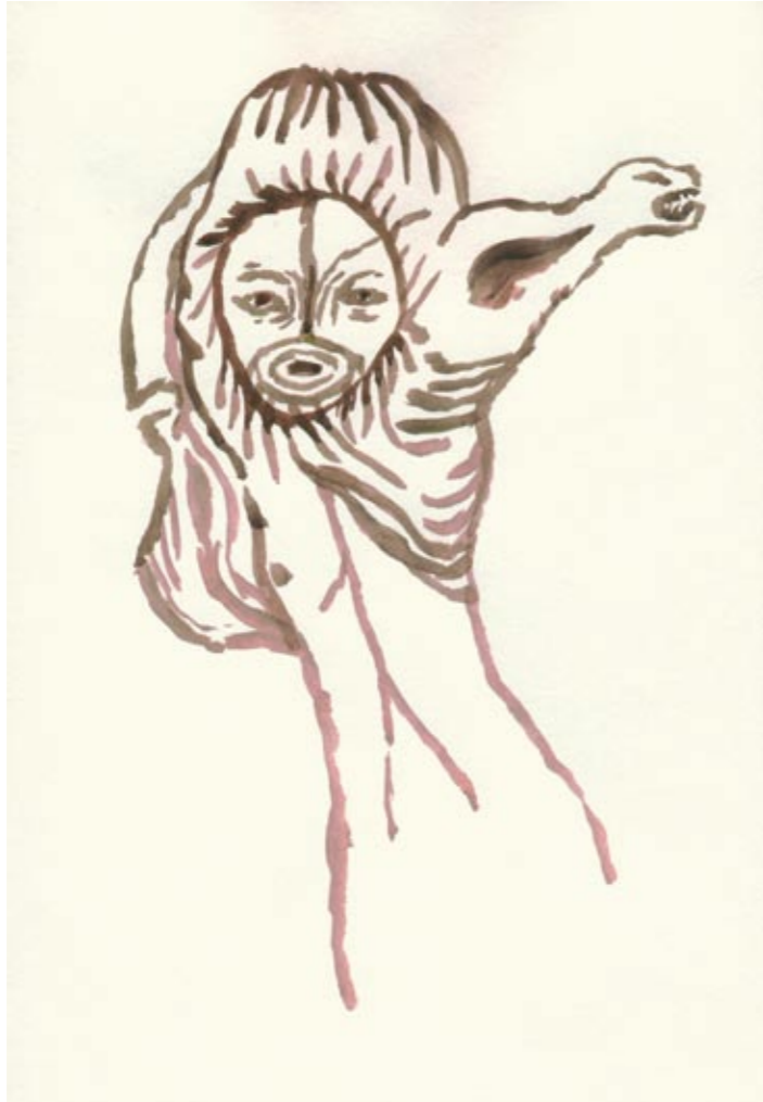
Krefter Tusi 34 x 26 cm