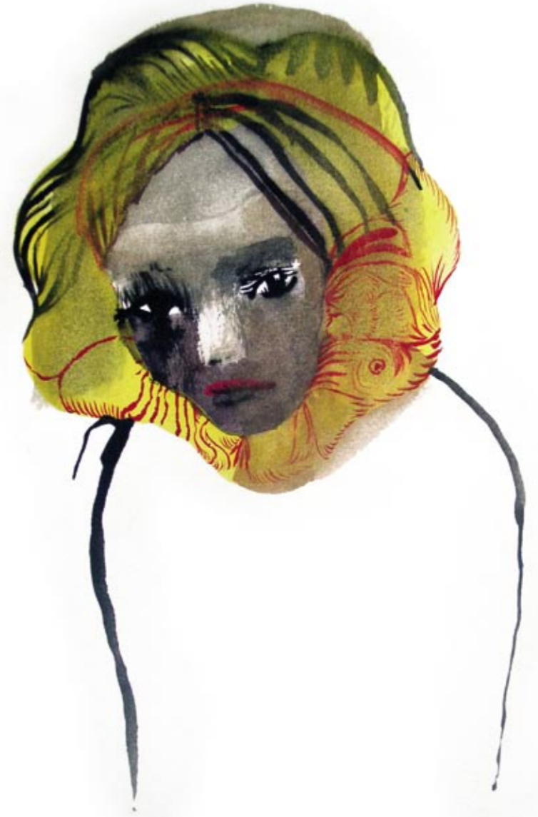
Som en blomst Tusi/gouache 30 x 23 cm