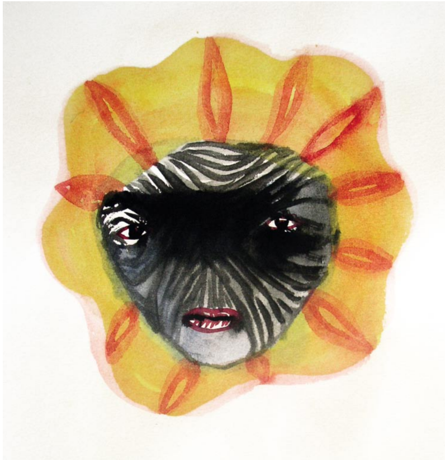
I forkledning Gouache 24 x 24 cm