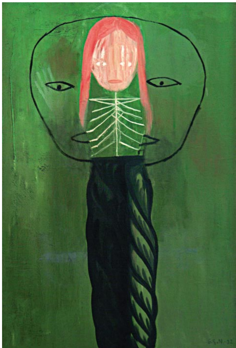
Sett Olje på lerret 107 x 73 cm