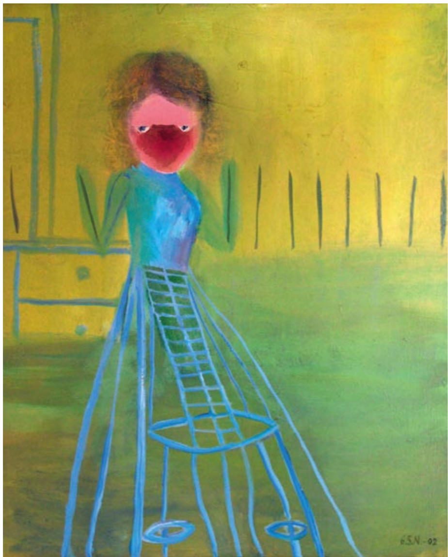
I en skuff Olje på lerret 65 x 54 cm