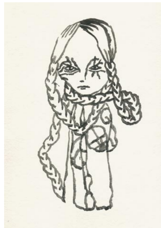
Innviklet Tusj 30 x 23 cm