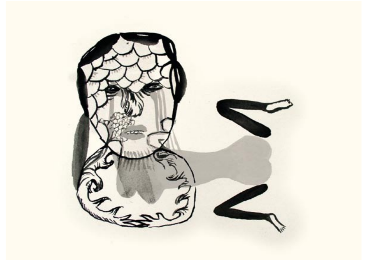
Uten tittel Tusj 23 x 30 cm