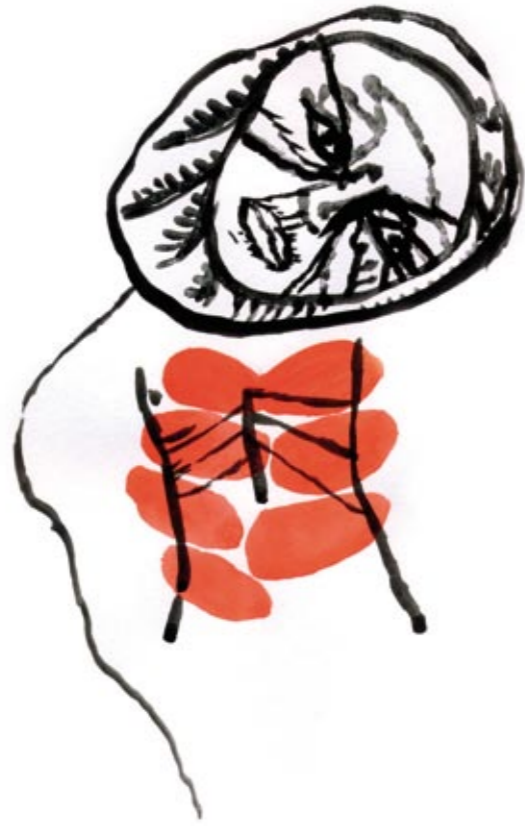
Kommer Tusj/gouache 34 x 26 cm