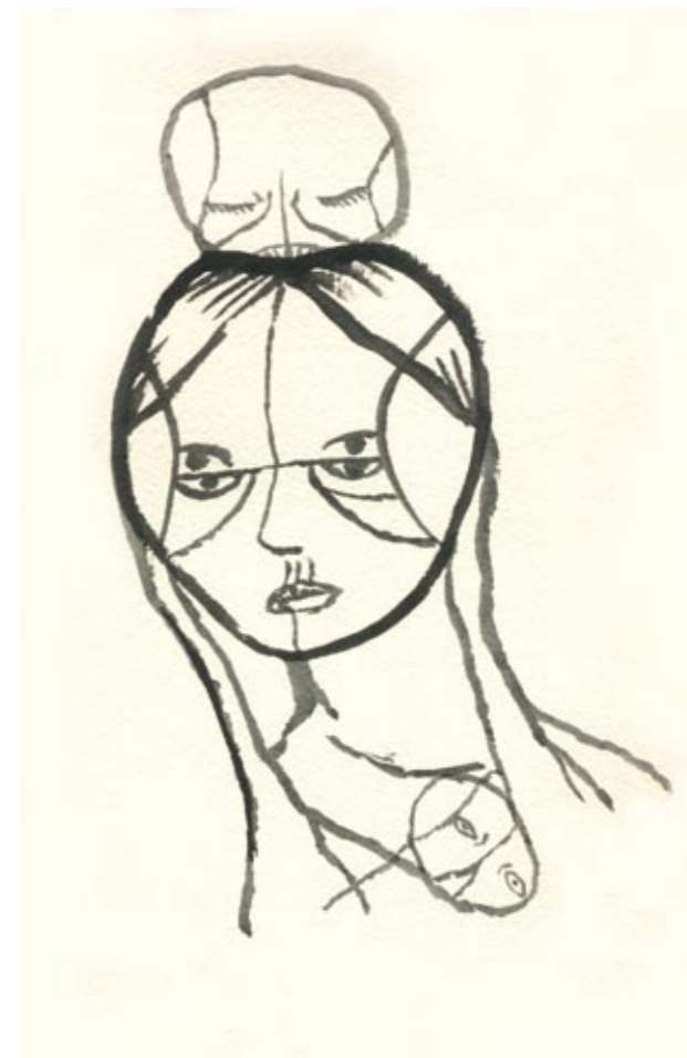
På vakt Tusj 30 x 23 cm