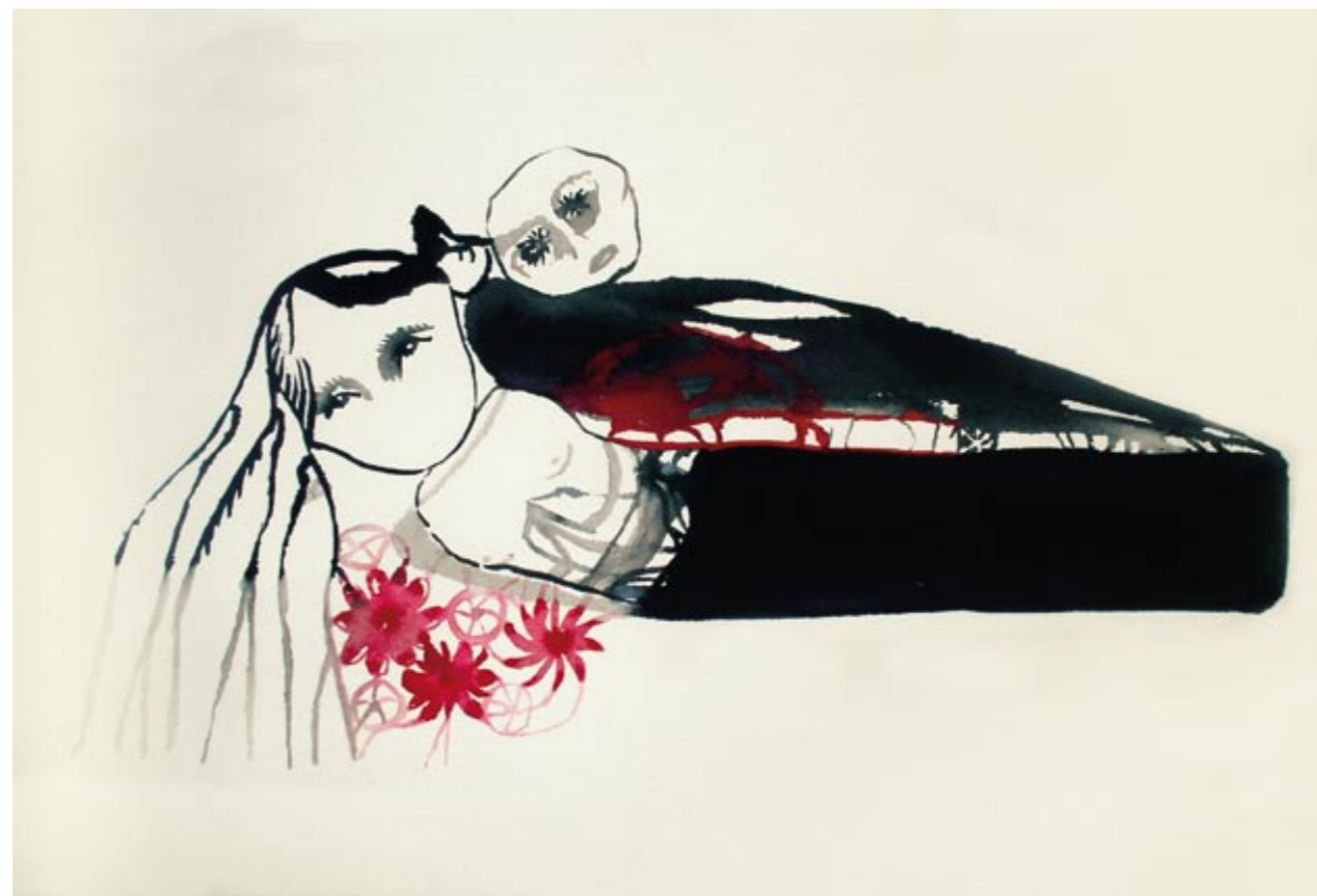
Uten tittel Tusj/gouache 27 x 40 cm