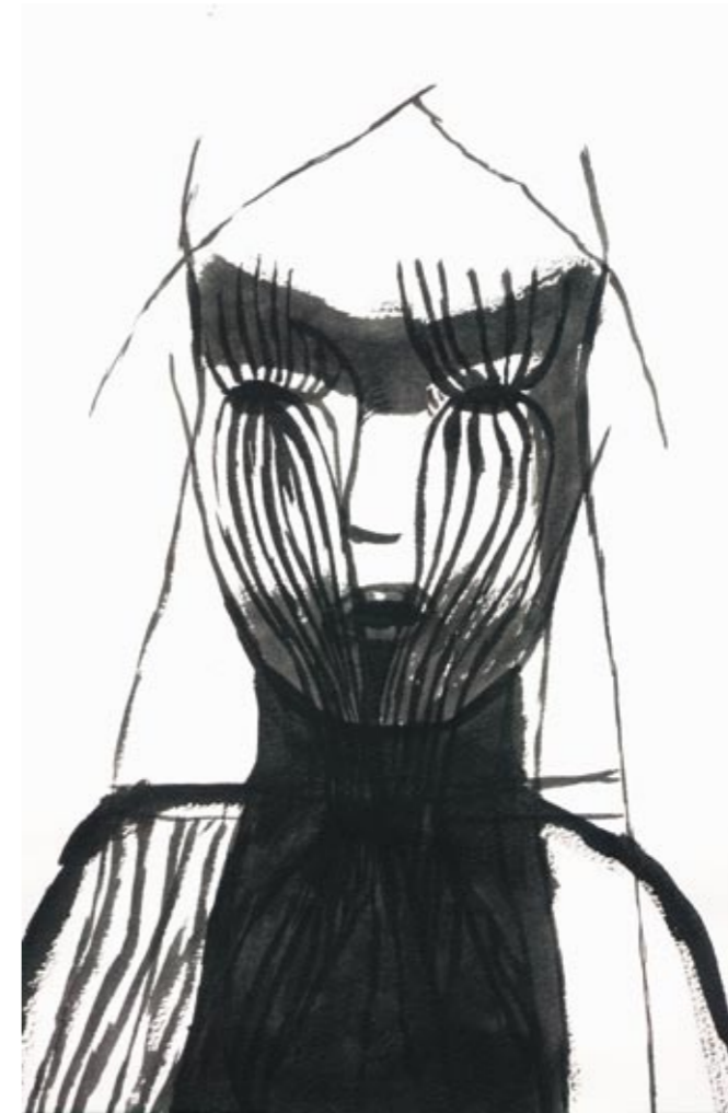
Strie strømmer Tusj 34 x 26 cm